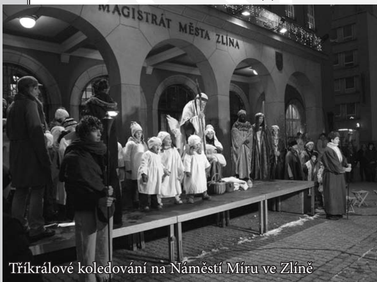
Tříkrálové koledování na Náměstí Míru ve Zlíně

Z línská Charita vyslala 269 skupinek koledníků v rámci zlínského a vizovického děkanátu do třech měst (Zlín, Slušovice, Vizovice), jejich částí (Jaroslavice, Klečůvka, Kostelec, Lůžkovice, Malenovice