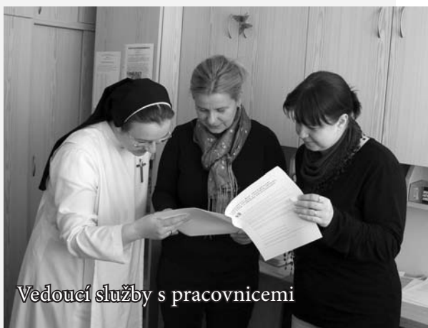
Vedoucí služby s pracovnicemi

Jsem ráda, že naše zkušenost z inspekce byla pro všechny pracovnice služby příjemná a přínosná. I přes některé nedostatky, na které inspekce poukázala, jsme byly pochváleny a v našem regionu jsme byly oceněny pomyslným vítězstvím, co do počtu získaných bodů v tomto roce. Velmi nás také potěšilo ústní ocenění našeho nekonfliktního a vlídného přístupu, neboť nám členové inspekčního týmu sdělili, že se u nás necítili jako „vetřelci“ a současně vyzvedli hladký průběh inspekce.