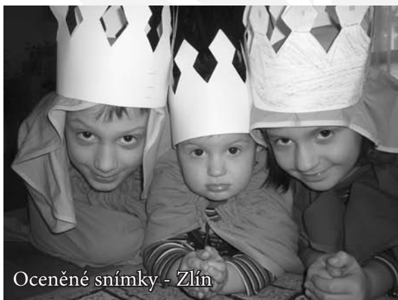
Oceněné snímky - Zlín