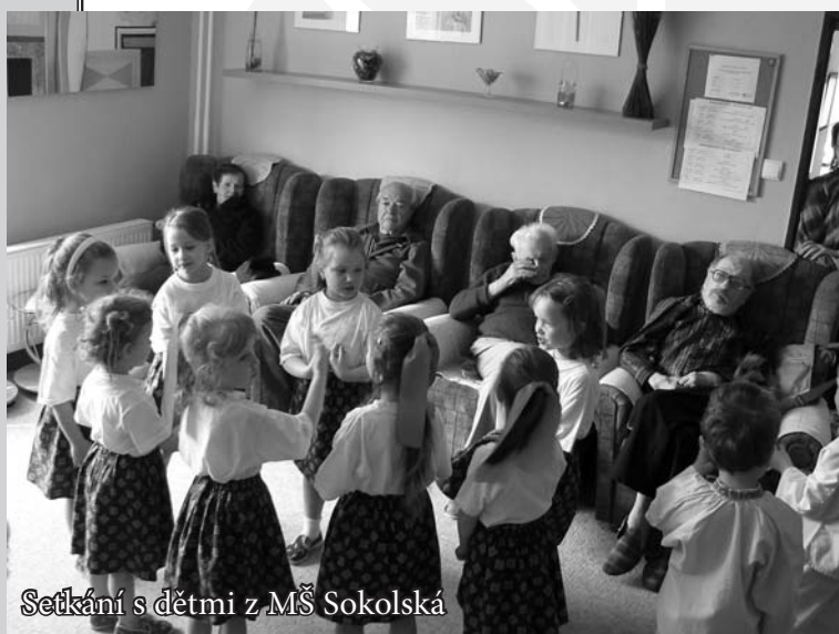
Setkání s dětmi z MŠ Sokolská

C ílem služby je * posílení schopnosti a dovednosti * podpora k samostatnosti * aktivizace, motivace a podněcování * pomoc při řešení osobních problémů * duchovní podpora * vytvoření příjemného „rodinného prostředí“ * zajištění denní péče v době, kdy rodinní příslušníci vykonávají svá zaměstnání.