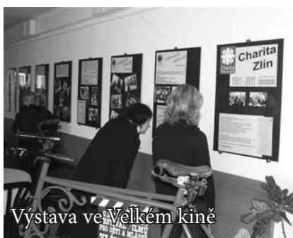
Výstava ve Velkém kině