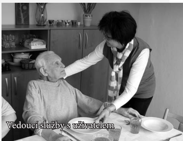
Vedoucí služby s uživatelem

J ako bývalý starosta Otrokovic i jako hejtman jsem se přesvědčil, že Charita kromě své každodenní péče o občany postižené nouzí funguje také jako pevná a spolehlivá opora ve vyhrocených situacích živelních pohrom, kdy se stává nedocenitelnou spolupracovnicí krizového řízení. Za to jí patří velké poděkování. Přeji Charitě Zlín dostatek obětavých pracovníků i podporovatelů, schopných vnímat službu potřebným jako samozřejmou součást mezilidské solidarity.