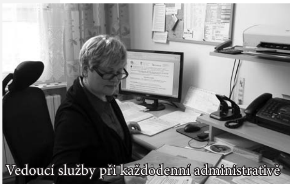
Vedoucí služby při každodenní administrativě

Jsem velmi rád, že se mohu připojit k dlouhé řadě gratulantů, protože si opravdu vážím toho, co Charita Zlín dělá pro potřebné. Za těch 20 let činnosti vykonala zlínská Charita mnoho dobrého. Připomeňme si, že se zabývá charitativní, zdravotní a humanitární činností, pomáhá lidem bez rozdílu, jediné kritérium, které je pro její pracovníky závazné, je potřeba jejich klientů. K svému poslání přistupuje svědomitě, a proto se zařadila mezi velmi respektované organizace. Pro město Zlín je velmi důležitým partnerem a má naši plnou podporu. Dovolte mi poděkovat pracovníkům Charity Zlín za vše, co během posledních 20 let vykonali. A popřát jim hodně elánu, nadšení a trpělivosti do roků příštích.