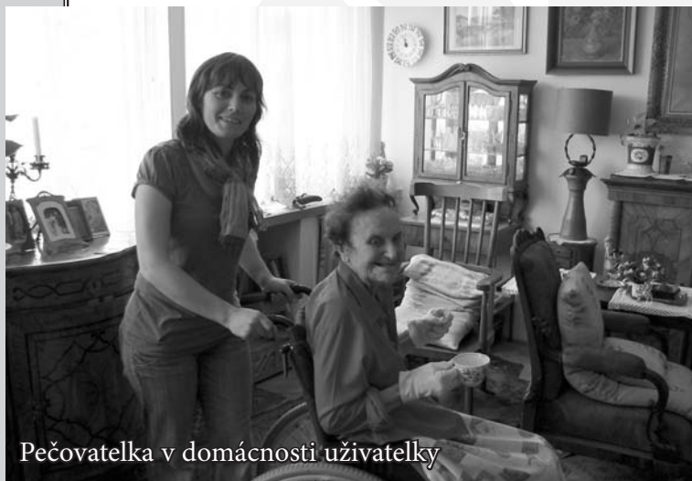
Pečovatelka v domácnosti uživatelky

Cílem pečovatelské služby je * zajistit bezpečné a odborné služby * podpořit běžný resp. dosavadní způsob života uživatele * podpořit jeho soběstačnost * a zmírnit osamělost a bezmocnost * umožnit, aby uživatel zůstal co nejdéle ve svém přirozeném prostředí * zajistit péči v době, kdy rodinní příslušníci vykonávají svá zaměstnání.