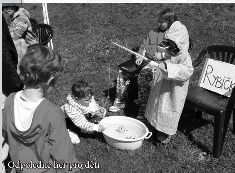
Odpoledne her pro děti

C haritní domov pro matky s dětmi v tísni (CHD) poskytuje azylové ubytování od června 1997. Základní činností služby je poskytnutí ubytování, pomoc při zajištění stravy a pomoc při uplatňování práv, oprávněných zájmů a při obstarávání osobních záležitostí. Fakultativní je programová činnost, což je aktivizační program (sociálně terapeutická