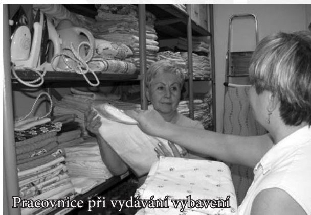
Pracovnice při vydávání vybavení

Posláním zařízení je poskytnout přechodné a bezpečné ubytování osobám pečujícím o osobu blízkou, které se ocitly v nepříznivé sociální situaci spojené se ztrátou bydlení. Poskytování služeb vychází z individuálních potřeb osob a podporuje jejich samostatnost a napomáhá k návratu nebo začleňování do běžného života. Přednostně je chráněn zájem nezletilého dítěte.