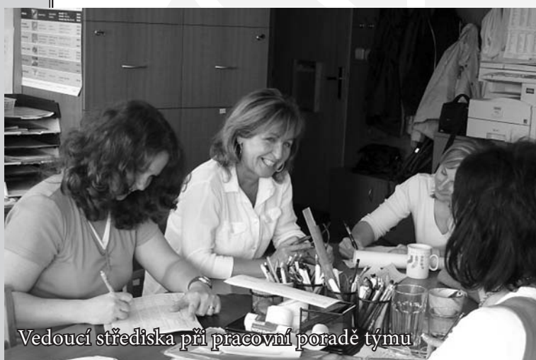
Vedoucí střediska při pracovní poradě týmu

C haritní ošetrovatelská služba Zlín (CHOS) je nejstarší součástí Charity Zlín (původně jako CHOPS - Charitní ošetrovatelská a pečovatelská služba, od roku 2007 tvoří obě části samostatná střediska). Poskytuje své služby od roku 1991, registrace