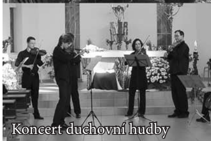
Koncert duchovní hudby