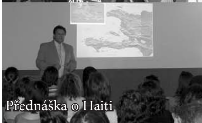
Přednáška o Haiti