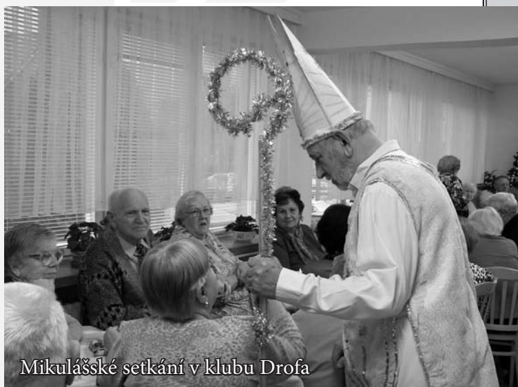
Mikulášské setkání v klubu Drofa

K lubová činnost, podporovaná drobnými dárci, je otevřena seniorům a osobám se zdravotním postižením a omezením. Většina návštěvníků jsou lidé ať už osamělí, či manželské páry, nad 65 let. Jako klubové programy jsou pořádány odborné přednášky, koncerty, divadelní představení, setkávání při nejrůznějších příležitostech (Vánoce, Velikonoce, Den matek atd.) a také poutní zájezdy.