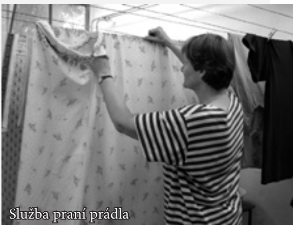
Služba praní prádla

Největší událost loňského roku nastala pro pracovníky střediska i pro Charitu Zlín jako celek 1. ledna, kdy pod její křídla přešla kompletní Pečovatelská služba zřízená Zlínským krajem. Nastalo navýšení nejen uživatelů přijímaných služeb, ale rozšířily se i řady zaměstnanců organizace. Tak došlo k definitivnímu osamostatnění sekcí střediska. A k