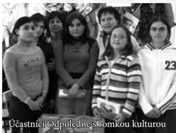
Účastníci Odpoledne s romskou kulturou