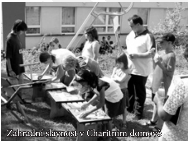
Zahradní slavnost v Charitním domově

V roce 2006 byla Zahradní slavnost - tradiční benefiční akce, kterou Charita Zlín některé předprázdninové odpoledne pořádá pro zlínské děti a jejich rodiče na půdě Charitního domova - přece jen v něčem jiná. Stala se totiž první a jistě největší doprovodnou aktivitou při oslavách patnáctého výročí založení zlínské Charity.