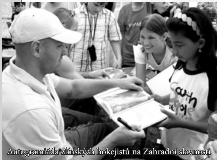
Autogramiáda zlínských hokejistů na Zahradní slavnosti

U živatelé služby jsou především ženy s nezaopatřenými dětmi v tíživé životní situaci vyžadující nouzové nebo dlouhodobé azylového ubytování. Nouzové ubytování trvá zpravidla nejdéle tři dny, standardní délka řádného pobytu je šest měsíců, podle potřeby je možné ji prodloužit.