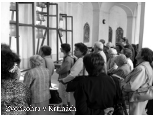
Zvonkohra v Křtinách