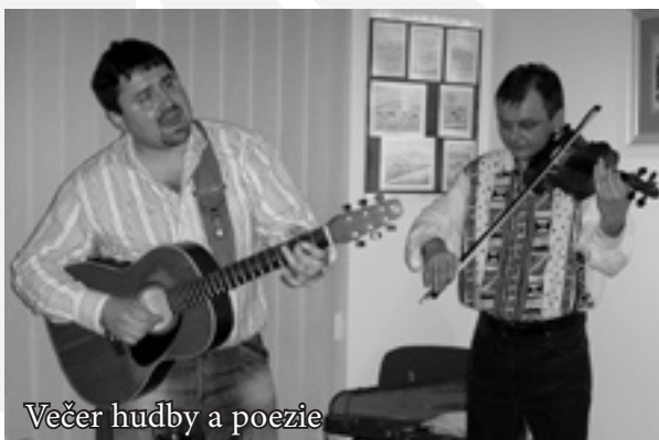
Večer hudby a poezie

Během loňského roku se objevila myšlenka posílit a rozšířit jednu z funkcí Chráněného pracoviště, jíž je provoz kavárny s galerií, o provoz cukrárny s vlastní výrobou sladkého pečiva. Byly propojeny obě dosud oddělené části prostor komplexu chráněného pracoviště tak, aby i návštěvníci prodejny výrobků