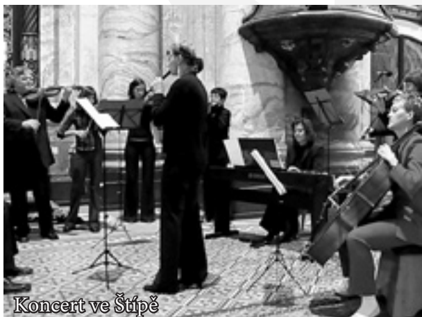
Koncert ve Štípkě

Své, pro posluchače jistě nezapomenutelné, umění předvedli žáci a učitelé Základní umělecké školy Morava a členové Filharmonie Bohuslava Martinů v komorním obsazení v římskokatolickém chrámu Narození Panny Marie ve Štípkě.