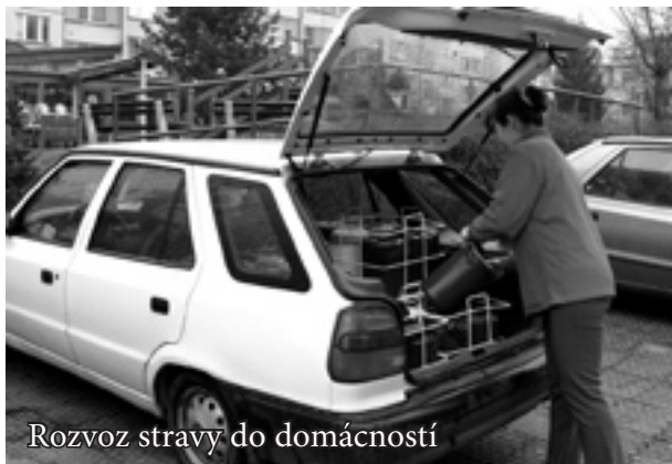
Rozvoz stravy do domácností

Převzetím Pečovatelské služby zřízené Zlínským krajem se Charitní ošetřovatelská a pečovatelská služba definitivně stala největším poskytovatelem těchto služeb na Zlínsku. Naším cílem je, aby byla poskytovatelem nejen největším, ale také nejlepším, nejspolehlivějším a ke svým klientům nejpřívětivějším.