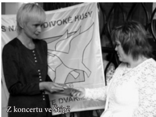
Z koncertu ve Štípkě

Benefiční koncert věnovaný tentokrát středisku Domovinka vynesl částku téměř dvanáct tisíc korun, která byla následně zdvojnásobena Nadací Divoké husy. Díky tomu mohlo být obnoveno vybavení centra novými křesly a obslužnými stolečky, neboť ty stávající již nevyhovovaly zdravému odpočinku stálých uživatelů jeho služby.