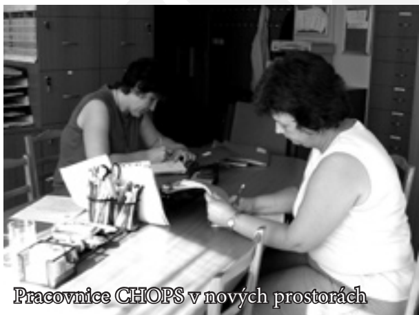
Pracovnice CHOPS v nových prostorách

Charitní ošetřovatelská a pečovatelská služba Zlín je nejstarším střediskem zlínské Charity. Byla založena v červnu roku 1991 a od prvních několika desítek uživatelů služeb se vypracovala do pozice jednoho z největších poskytovatelů ošetřovatelských a pečovatelských služeb na Zlínsku.