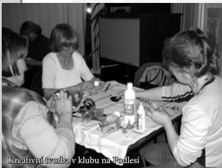
Kreativní tvorba v klubu na Podlesí

V ětšina uživatelů Charitního klubu seniorů jsou lidé nad 65 let. Jsou mezi nimi osoby se zdravotním postižením a omezením, lidé handicapovaní, manželské páry i lidé zcela osamocení.