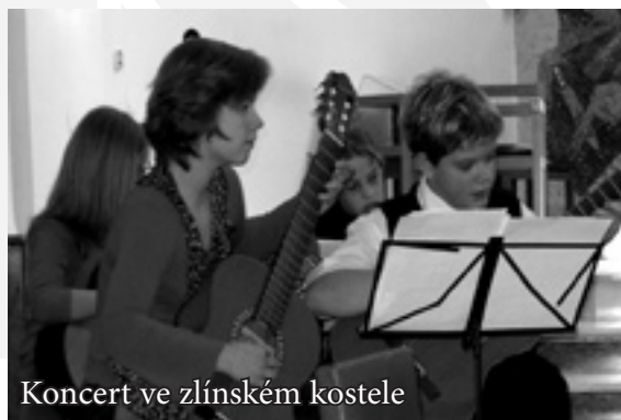
Koncert ve zlínském kostele

23. dubna jsme ve spolupráci se Základní uměleckou školou Štefánikova Zlín uspořádali Duchovní koncert s myšlenkami Matky Terezy. Koncert se konal v Kostele sv. Filipa a Jakuba a sloužil zároveň jako poděkování koledníkům Tříkrálové sbírky a všem našim spolupracovníkům a příznivcům.