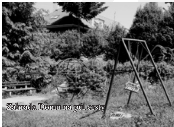
Zahrada Domu na půl cesty

Dům na půl cesty na Kamenné ulici je provozován Statutárním městem Zlín a nabízí ubytování ve dvanácti malometrážních bytových jednotkách (tzv. startovací byty) sociálně slabým mladým rodinám a bývalým klientům dětských