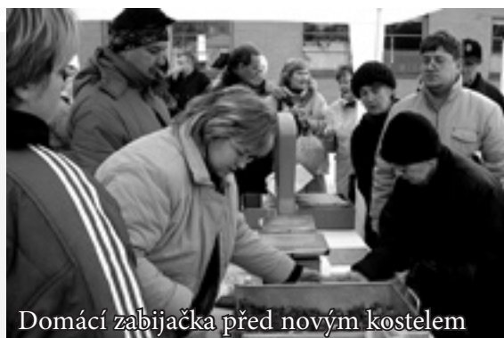
Domáci zabijačka před novým kostelem

7. ledna jsme jako jednu z doprovodných akcí probíhající Tříkrálové sbírky spolu se Salesiánským střediskem ve Zlíně uspořádali již tradiční Domáci zabijačku. Uprostřed největšího zlínského sídliště Jižní Svahy šla nejvíce na odbyt zabijačková polévka a křupavé škvarky.