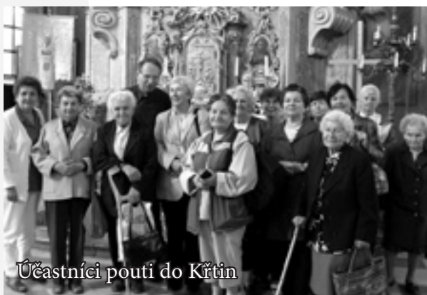
Účastníci pouti do Křtin

Programu poutního zájezdu byla Mše svatá a Křížová cesta se svými čtrnácti zastaveními. Na celkové pozitivní vnímání netradičního výjezdu mělo jistě vliv přímo samotné poutní místo, které patří k nejstarším a nejkrásnějším u nás. Podle starého vyprávění ve zdejším údolí křtili věrozvěsti svatí Cyril a Metoděj a jejich žáci. Proto i starobylý název místa: Vallis baptismi – údolí křtu – Křtiny.