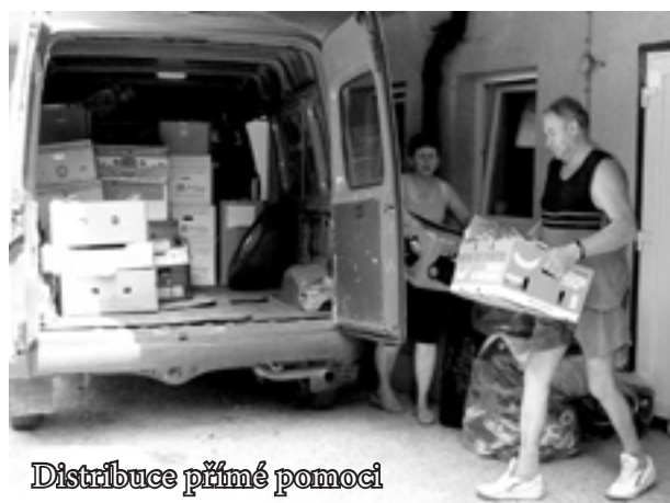
Distribuce přímé pomoci

N ové a kvalitnější prostory jsou příjemné samozřejmě i pro další složky činnosti centra, například poskytování poradenských služeb, které zůstávají jádrem jeho činnosti. Jak již bylo naznačeno, stěhování nepostihlo všechny části centra; charitní šatník stále sídlí a je pro veřejnost otevřen na své původní adrese na Burešově.