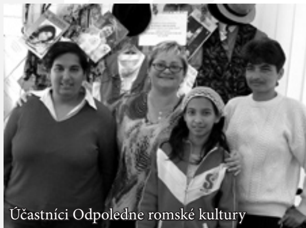
Účastníci Odpoledne romské kultury

Reprodukováná hudba a úvodní videofilm o romské kultuře - tak vypadalo zahájení romského odpoledne, které každoročně na podzim pořádá zlínská Charita v prostorách svého chráněného pracoviště na Jižních Svazích ve spolupráci s Demokratickou aliancí Romů ve Zlíně a Valašském Meziříčí. K tradičním aktivitám patří kromě dnů romské kultury a kuchyně také přednášková činnost