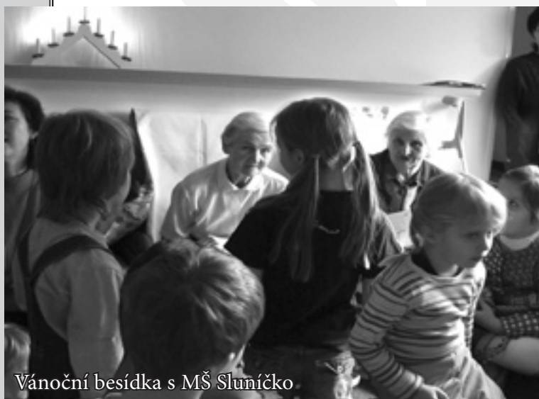
Vánoční besídka s MŠ Sluníčko

C ílem služby je zajistit péči ženám-seniorkám ze Zlína a okolí, které v důsledku snížení soběstačnosti nemohou být samy ve své domácnosti a které zároveň navzdory svým zdravotním problémům chtějí prožívat dny mezi svými vrstevníky, kteří jim rozumějí, a to v příjemném a vstřícném prostředí zařízení. Cílem služby je usnadnit rodinám uživatelů vykonávat běžné a standardní činnosti v době, kdy jejich blízcí pobývají v našem zařízení.