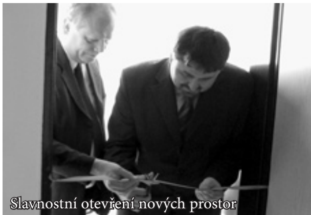
Slavnostní otevření nových prostor

Rozšíření prostor o dvě bytové jednotky se uskutečnilo díky pomoci Statutárního města Zlín, které veškeré stavební úpravy po finanční stránce vzalo na svá bedra. Vybavení nových ubytovacích jednotek potřebným zařízením pak zůstalo na Charitě Zlín.