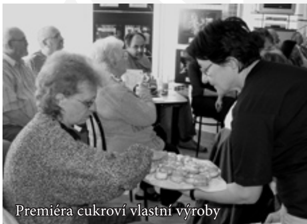
Premiéra cukroví vlastní výroby

Pracovní činnosti, které vykonávají uživatelé služeb a zároveň zaměstnanci Chráněného pracoviště Charity Zlín, prošly za dobu existence střediska zajímavým vývojem. Chráněné pracoviště bylo od začátku koncipováno jako místo, kde by se především měly prodávat výrobky chráněných dílen neziskových organizací z Moravy, a také jako místo, které by vytvářelo zázemí pro seniory a zdravotně postižené, kteří žijí v okolí pracoviště na sídlišti Jižní Svahy.