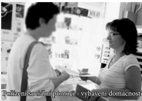
Pořízení sociální pomoci - vybavení domácnosti

T ato změna se samozřejmě nedotkla jenom pracovníků Charity Zlín, ale také uživatelů jejich služeb. Právě jim měla tato změna nejvíce pomoci, protože stěhování střediska proběhlo zejména proto, aby bylo možno nabídnout nové služby, které dosud chyběly a jejichž potřeba byla zjevná. To se týká především zázemí k poskytnutí osobní hygieny uživatelům služby v nově vybudovaném sociálním zařízení.