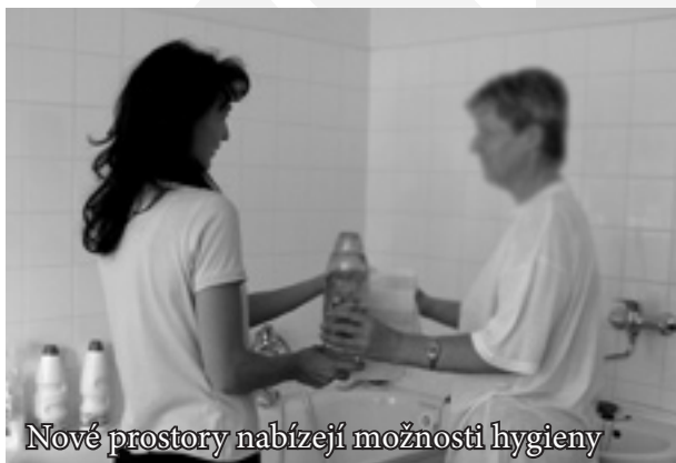
Nové prostory nabízejí možnosti hygieny

B ěhem roku 2006 se prakticky všechna střediska Charity Zlín přestěhovala, nebo alespoň rozšířila své stávající prostory. Stěhování se nevyhnulo ani Charitnímu centru sociální pomoci; na novou adresu se přestěhovalo samotné jeho ústředí.