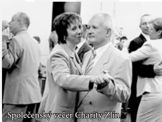
Společenský večer Charity Zlín