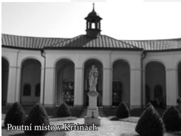
Poutní místo v Křtinách

Výlety na poutní místa patří k tradičním aktivitám Charitních klubů seniorů. Letošní zájezd byl ovšem v něčem netradiční. Úplně poprvé totiž členové klubu navštívili překrásné poutní místo v Křtinách u Brna.