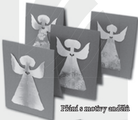
Přání s motivy andělů