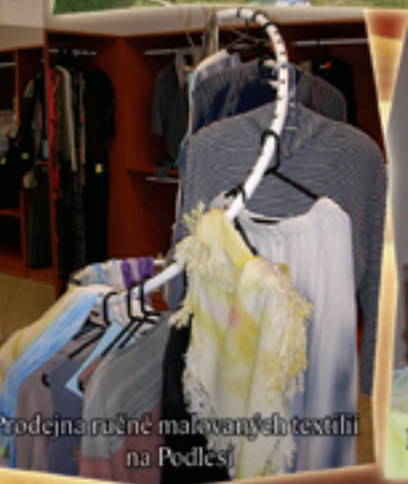
Prodejna ručně malovaných textilií na Podlesí