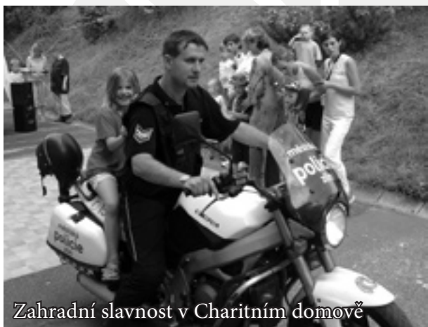
Zahradní slavnost v Charitním domově

Přestože původním posláním Charitního domova vždy bylo a nadále zůstává poskytovat pomoc ženám s nezaopatřenými dětmi v tíživé životní situaci, v minulosti jsme se stále častěji setkávali s tím, že o naše služby jevíly zájem také jiné skupiny sociálně potřebných. Byly to zejména těhotné ženy, jimž poradenské i ubytovací služby již tradičně poskytujeme, v několika případech se na nás obrátili také muži s dětmi, jimž jsme se v zájmu dětí také snažili co nejvíce pomoci.