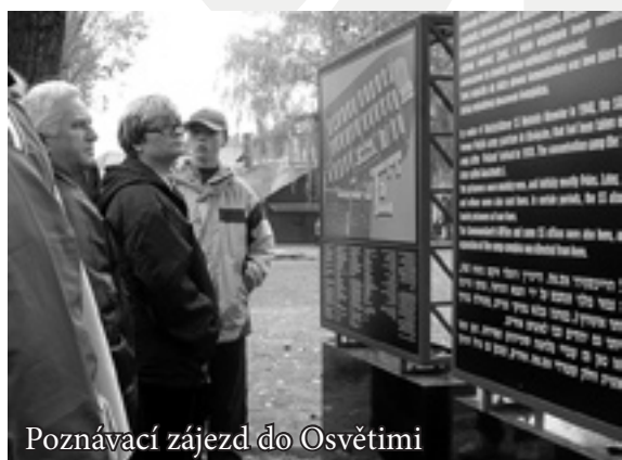
Poznávací zájezd do Osvětimi

Cílem projektu Romský horizont (RH) je postupné překonávání bariér ve vzájemné komunikaci mezi většinovou společností a příslušníky romského etnika, kteří žijí ve Zlíně a okolí. Filozofií projektu je naplnění možnosti vzájemného setkávání, díky němuž se mohou dosud neznámí lidé lépe poznat a odstranit tak sami v sobě předsudky, které vůči sobě případně mají. Neboť právě neznalost nejčastěji plodí strach, od nějž je již jenom krůček k otevřeně projevené nevraživosti. V rámci projektu Romský horizont jsou připravovány kulturní a společenské akce, jako například dny romské kultury, romské kuchyně, výstavy děl romských umělců a podobně. Kromě toho jsou náplní projektu výchovné a vzdělávací akce pro romské rodiny s dětmi. Na všech aktivitách spolupracujeme s romskými organizacemi, jejichž vlastním aktivitám též poskytujeme zázemí v prostorách Charity Zlín na Jižních Svazích - Podlesí.