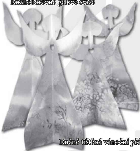
Ručně tištěná vánoční přání