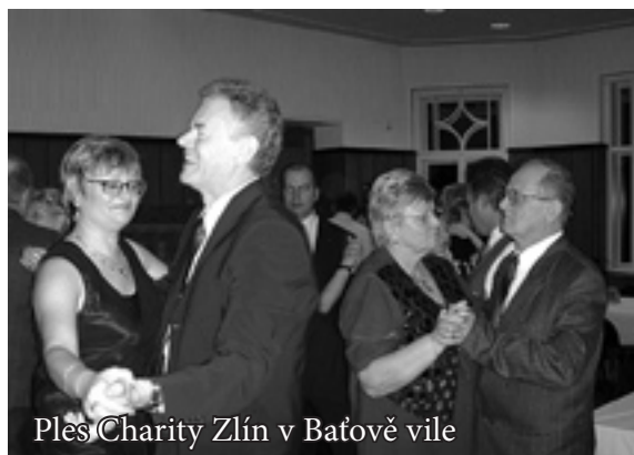
Ples Charity Zlín v Baťově vile

19. listopadu 2004 jsme uspořádali v reprezentativních prostorách Vily Tomáše Bati tradiční Ples Charity Zlín. Celý večer byl koncipován jako poděkování sponzorům, spolupracovníkům a pracovníkům organizací a institucí, které v právě končícím roce s Charitou Zlín spolupracovaly.