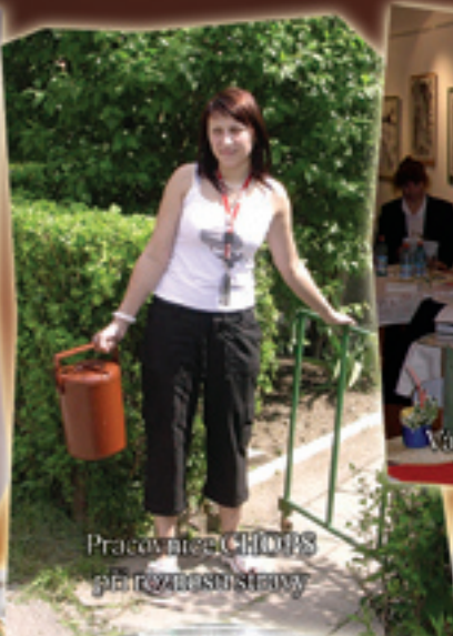
Pracovnice CHOPS při rozvozu stavy