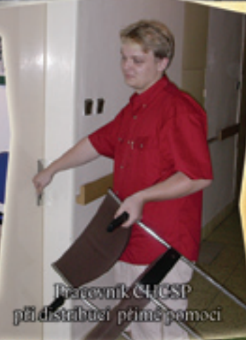
Pracovnice CHOSP při distribuci přímé pomoci