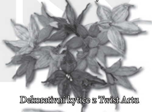
Dekorativní kytice z Twist Artu