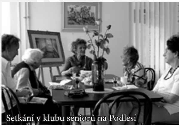
Setkání v klubu seniorů na Podlesí

Výsledky byly v mnohých ohledech zajímavé. Ukázalo se například, že se naši klienti chtějí dozvědět více o internetu a že je zajímaví ruční práce. Velká část z nich projevila přání pořádat v klubových prostorech vlastní akce a oslavy, ovšem s tím, že jim je pracovníci Charity pomohou uspořádat.