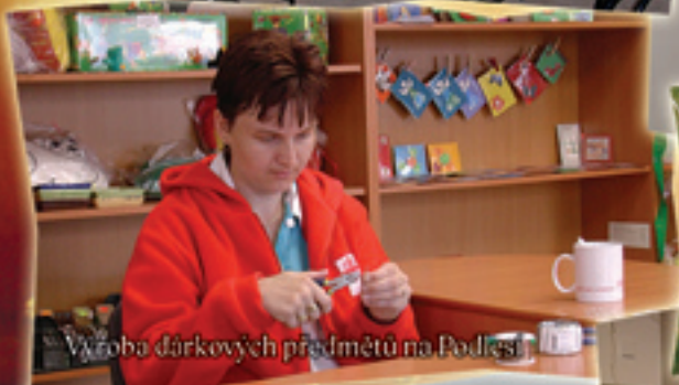
Výroba dárkových předmětů na Podlesí