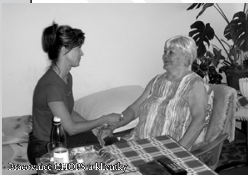
Pracovnice CHOPS u klientky

Charitní ošetřovatelská a pečovatelská služba Zlín (CHOPS) je nejstarší součástí Charity Zlín. Poskytuje své služby od roku 1991. Jde o agenturu domácí péče, jejímž posláním je nabídnout pomoc lidem v nepříznivé zdravotní a sociální situaci, která vznikla v důsledku jejich věku, nemoci nebo ztráty soběstačnosti. Díky této péči mají uživatelé možnost žít i nadále doma ve svém přirozeném prostředí a zachovat si tak křehkou síť emocionálních a sociálních vazeb na své okolí.