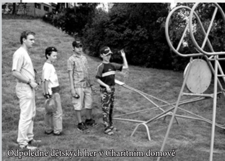
Odpoledne dětských her v Charitním domově

S lužba směřuje k řešení a prevenci sociálně-patologických jevů, se kterými se uživatelé služeb potýkají. Jde zejména o fyzické a psychické domácí násilí,