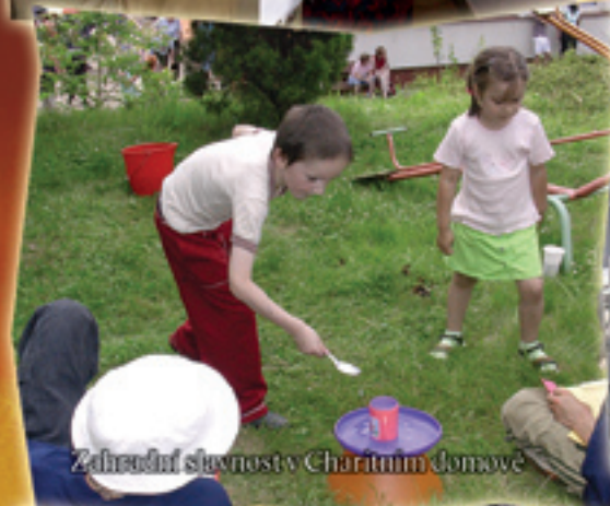
Zdravotní slavnost v Charitním domově