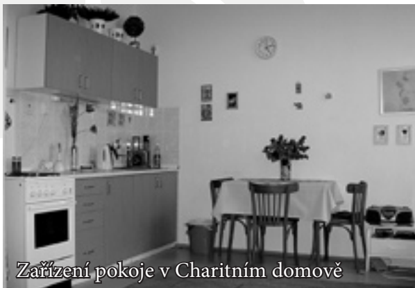
Zařízení pokoje v Charitním domově

Po několika jednáních nám v dubnu roku 2004 udělil Krajský úřad Zlínského kraje povolení k výkonu sociálně-právní ochrany dětí v rozsahu zřizování a provozu zařízení pro děti vyžadující okamžitou pomoc. Dítěti, které se k nám dostane, poskytneme prostor k osobní hygieně, dáme mu najíst a ubytujeme je