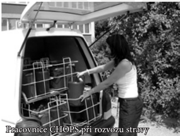
Pracovnice CHOPS při rozvozu stravy

Před nějakým časem se dostalo medializace problému distribuce stravy do domácností klientů pečovatelských služeb. Podle vyhlášky ministerstva zdravotnictví se stávající systém rozvozu stravy v klasických jídlonosičích stal nevyhovujícím, neboť podle předpisů bylo třeba, aby strava dodávaná klientům pečovatelských služeb byla buď chlazená, nebo měla teplotu minimálně 67°C.