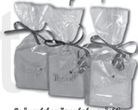
Sada svíci s věnováním z dřátku