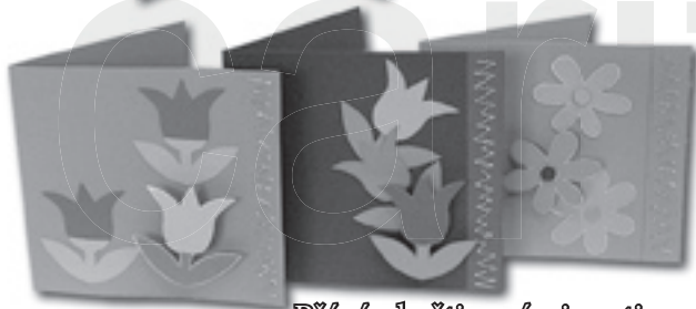
Přání s květinovými motivy