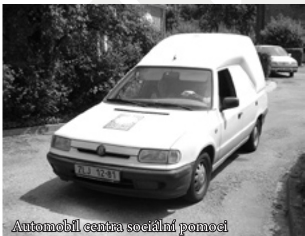
Automobil centra sociální pomoci

Charita Zlín nebyla ani zdaleka jedinou organizací, které přinesl vznik profesionální Armády v naší republice a s ním související zánik civilní služby nemalé problémy. Vlastně všechna střediska Charity Zlín „civiláky“ čas od času nějakým způsobem využívala. Nejvíce jich ovšem bylo vždy zapotřebí v Charitním centru sociální pomoci,