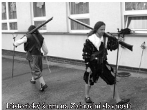
Historický šerm na Zahradní slavnosti

11. června 2004 se v Charitním domově pro matky s dětmi v tísni konal již pátý ročník Zahradní slavnosti. I tentokrát byly připraveny hry a soutěže pro děti, divadelní představení, vystoupení tanečních skupin a skupin historického šermu, ukázky práce hasičů a policie a samozřejmě pro všechny také bohaté občerstvení a tombola.