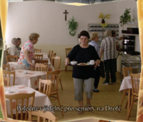
Polednev jídelně pro seniory na Drožě