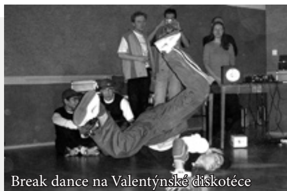
Break dance na Valentýnské diskotéce

14. února 2004 se v Klubu pod věží v novém zlínském kostele Panny Marie Pomocnice Křesťanů uskutečnila Valentýnská diskotéka Charity Zlín. Každý pracovník Charity si mohl přivést někoho, koho má rád, nechyběl ovšem ani doprovodný program v podobě vystoupení profesionálních tanečníků.