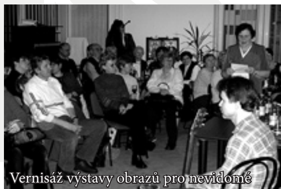
Vernisáž výstavy obrazů pro nevidomé

4. června 2004 se v Galerii Chráněného pracoviště Charity Zlín na Podlesí konal Koncert bez přestávky v podání souboru Musica Grata. Tímto koncertem jsme se zapojili do 10. ročníku Dnů nevidomých na Moravě, kterou pořádá Sjednocená organizace nevidomých a slabozrakých.