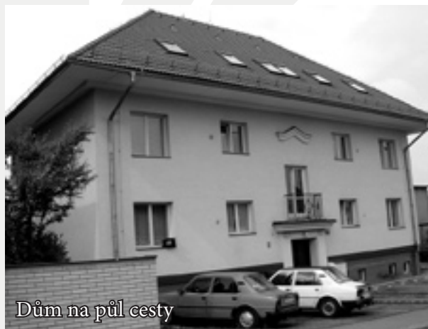
Dům na půl cesty

Výsledkem spolupráce Charity Zlín se Statutárním městem Zlín je provoz Domu na půl cesty. Jedná se o zařízení města Zlín, ve kterém je dvanáct malometrážních bytových jednotek, které jsou jako dočasné startovací byty určeny pro bývalé klienty zlínského Dětského domova, případně jsou též nabízeny sociálně slabým mladým rodinám. Aktivitou Charity Zlín v této vzájemné spolupráci je zajišťování sociálního poradenství uživatelům služeb Domu na půl cesty. Poradenská a konzultační činnost zahrnuje také zprostředkování kontaktu s úřady, institucemi a dalšími organizacemi, případně též pomoc při hledání vlastního bydlení a zaměstnání. Důležitou složkou komplexu služeb jsou také edukativní programy, v jejich rámci jsou klienti připravováni na situace, ve kterých se mohou po odchodu z Domu na půl cesty ocitnout.