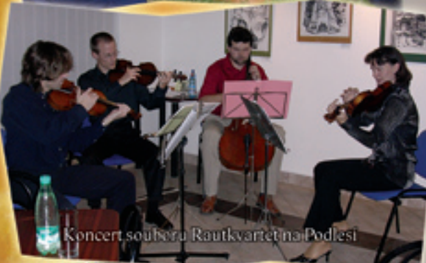
Koncert souboru Rautkvartet na Podlesí