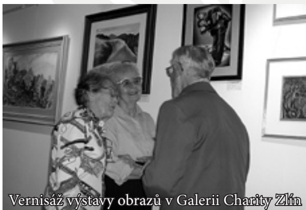
Vernisáž výstavy obrazů v Galerii Charity Zlín

Uživatelé služeb Chráněného pracoviště Charity Zlín se od samotného jeho vzniku podíleli především na přípravě společenských akcí v Kavárně s galerií a Klubu seniorů a pracovali též jako obsluha v prodejně výrobků chráněných dílen. Tím se naše pracoviště nejvíce lišilo od většiny chráněných dílen, ve kterých se postižení věnují rukodělné výrobě různých dekorativních a užitkových předmětů. Chráněné pracoviště Charity Zlín jsme chápali jako jakousi prodlouženou ruku těchto chráněných dílen, díky níž mají možnost své výrobky nabídnout veřejnosti.