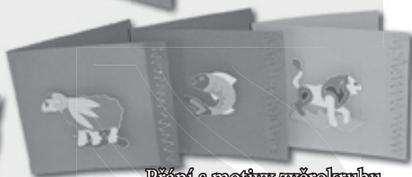
Přání s motivy zvěrokruhu