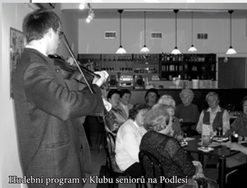
Hudební program v Klubu seniorů na Podlesí

Charitní kluby seniorů (CHK) se snaží nabídnout společenské vyžití lidem, kterým v důsledku jejich věku, zdravotního stavu a často také vinou nedostatečného zájmu okolí rapidně ubývá možností společenských kontaktů. Většina klientů Charitního klubu seniorů jsou lidé nad 65 let. Jsou mezi nimi lidé se zdravotním postižením a omezením, lidé handicapovaní, manželské páry i lidé osamocení.