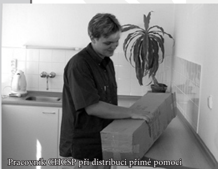
Pracovník CHCSP při distribuci přímé pomoci

Charitní centrum sociální pomoci Zlín (CHCSP) vyvíjí své aktivity od roku 1994. Jde o zařízení prvního kontaktu, nouzové i kontinuální sociální pomoci osobám v sociální a ekonomické nouzi, které nejsou schopny svou tíživou situaci vyřešit vlastními silami. Jeho klienty jsou zejména mladé rodiny s více dětmi či neúplné rodiny, senioři, dlouhodobě nemocní, nezaměstnaní, bezdomovci a lidé v problematické rodinné či bytové situaci, příslušníci národnostních menšin a žadatelé o azyl v České republice.