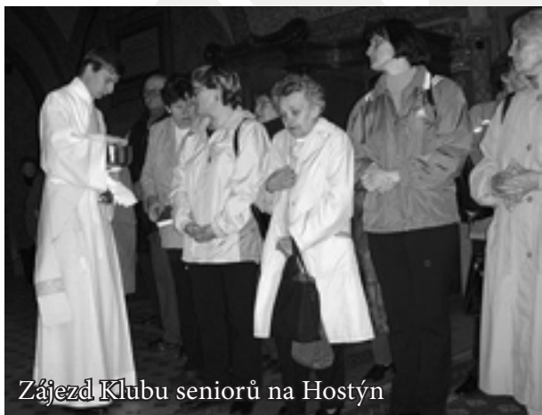
Zájezd Klubu seniorů na Hostýn

Při přípravě programů v Charitních klubech seniorů jsme se vždy snažili vycházet z přání samotných uživatelů služeb. Snažili jsme se jim naslouchat a zjišťovat, o jaký druh programů mají zájem, a podle toho jsme akce ve všech třech klubových zařízeních plánovali. Jak tomu ale tak bývá, k programům se vyjadřovali