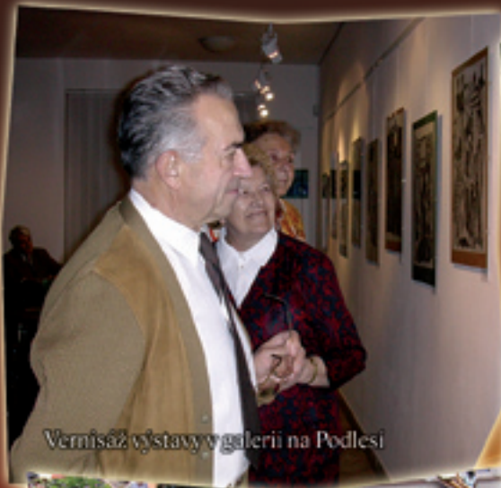
Vernisáž výstavy v galerii na Podlesí