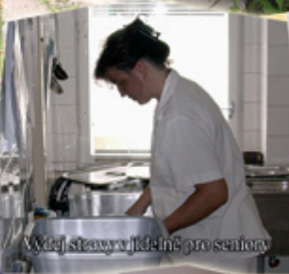
Výdej stavy v jídelně pro seniory