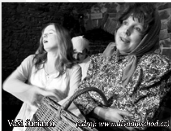
Vaši furianti

30. října 2004 jsme uspořádali druhé benefiční divadelní představení v tomto roce, opět na Malé scéně v podání Divadla Schod, tentokrát hry Vaši furianti. Jedná se o svéráznou adaptaci klasického kusu, kterou mohli diváci shodou okolností srovnat s originálem dávaným ve stejné době ve zlínském Městském divadle.