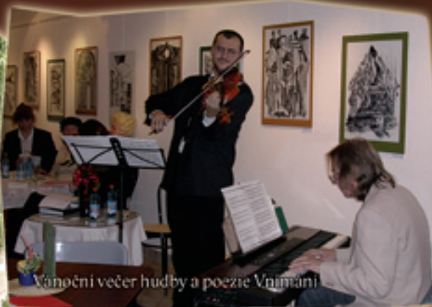
Vánoční večeř hudby a poezie Vnímání