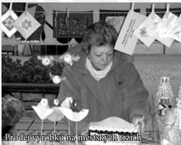
Prodej výrobků na městských trzích

Teprve v minulém roce se nám podařilo vlastní výrobu více rozšířit. Náš sortiment jsme doplnili o kytičky z tzv. Twist Artu, vyšívání přání s nejrůznějšími motivy, lepená přání, z nichž jsme vytvořili celou řadu „Znamení zvěrokruhu“, kde jsou jednotlivá znamení připevněna k přání na pružince a po otevření se zachvějí, přání ve tvaru andílků, která