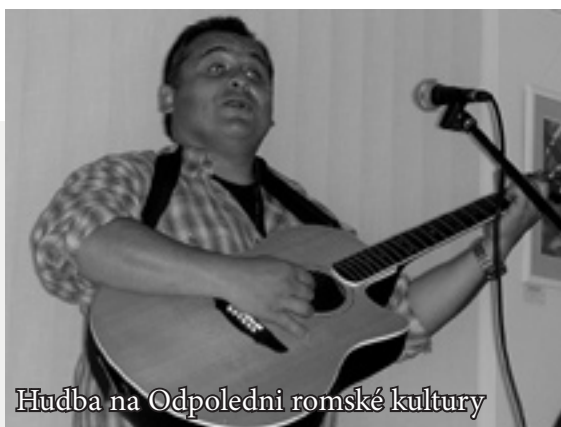
Hudba na Odpoledni romské kultury

15. října 2004 jsme v prostorách Chráněného pracoviště Charity Zlín uspořádali Odpoledne romské kultury. Součástí byla výstava romského umění a folklóru, ukázka romské kuchyně, vystoupení romských umělců a též prezentace odborných prací týkajících se situace romské menšiny v České republice.