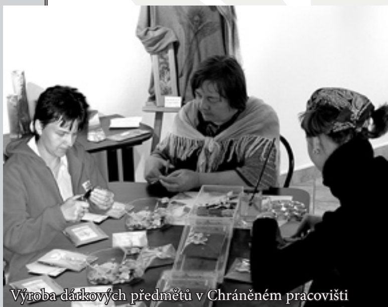
Výroba dárkových předmětů v Chráněném pracovišti

Chráněné pracoviště Charity Zlín (CHP) bylo otevřeno v červnu roku 2001. Motivací pro jeho zřízení byla snaha nabídnout pracovní uplatnění osobám se změněnou pracovní schopností, které byly delší dobu v evidenci Úřadu práce. Hlavní ideou projektu je nabídnout těmto lidem možnost kontaktu se společenským prostředím v rámci pracovního kolektivu i navenek a tím jim zároveň poskytnout účinnou pracovní terapii. Do konce roku 2004 v Chráněném pracovišti Charity Zlín našlo zaměstnání celkem sedm uživatelů služeb.