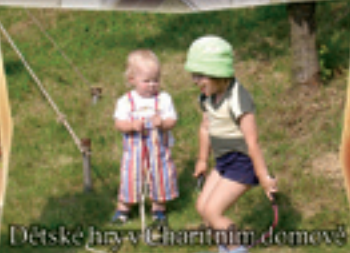
Dětské hry v Charitním domově