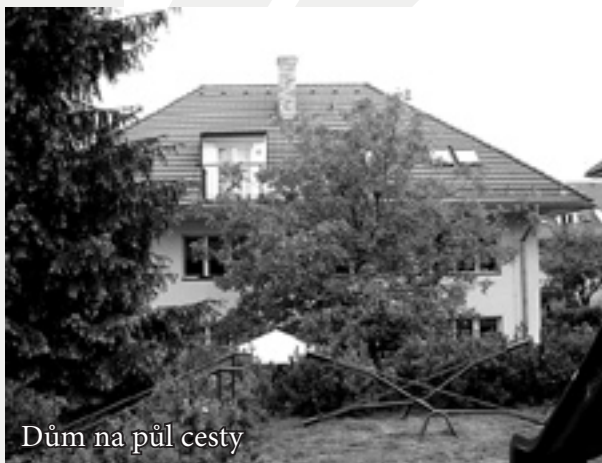
Dům na půl cesty

D ům na půl cesty na Kamenné ulici je provozován Statutárním městem Zlín a nabízí ubytování ve 12 malometrážních bytových jednotkách (tzv. startovací byty) sociálně slabým mladým rodinám a bývalým klientům Dětského domova Lazy. Na základě smlouvy se Statutárním městem Zlín zde sociální pracovnice Charity Zlín spolupracuje se zletilými klienty Dětského domova Lazy a s klienty Domu na půl cesty, kterým poskytuje poradenství a zprostředkovává kontakt s Magistrátem města Zlína, Úřadem práce, zdravotnickými zařízeními a dalšími odborníky, například s psychology či psychiatry, a pomáhá jim při hledání vlastního bydlení a zaměstnání. V rámci edukativních programů se snaží klienty připravit na situace, ve kterých by se mohli po odchodu z Domu na půl cesty ocitnout.