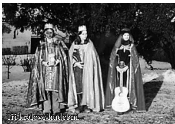
Tři králové hudební...

N aše poděkování patří pracovníkům magistrátních, městských a obecních úřadů v jednotlivých obcích, duchovním správcům všech farností, místním