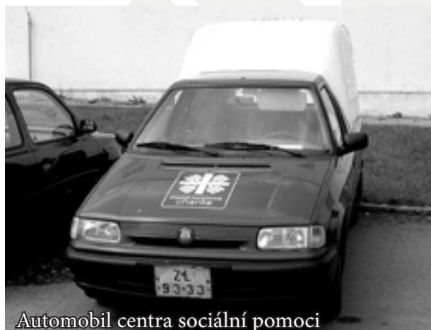
Automobil centra sociální pomoci