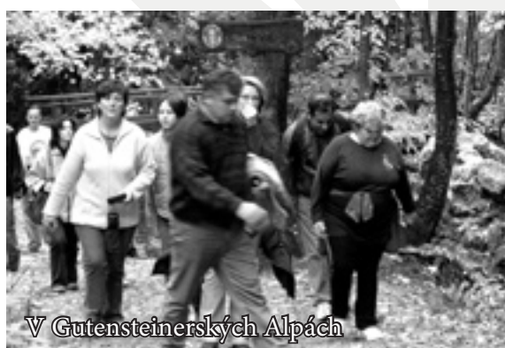
V Gutensteinerských Alpách

4. října 2003 jsme v rámci projektu Romský horizont přichystali zájezd pro romské děti a jejich rodiče do Gutensteinerských Alp. Druhý zájezd v rámci tohoto projektu se uskutečnil již 18. října, tentokrát do Osvietimi v Polsku, místa, které je smutným způsobem spojeno s historií Romů.