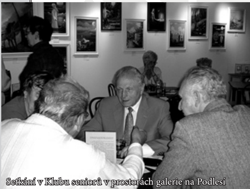
Setkání v Klubu seniorů v prostorách galerie na Podlesí

Charitní kluby seniorů (CHK) se snaží nabídnout společenské vyžití lidem, kterým v důsledku jejich věku, zdravotního stavu a často také vinou nedostatečného zájmu okolí rapidně ubývá možnost společenských kontaktů. Většina klientů Charitního klubu seniorů jsou lidé nad 65 let. Jsou mezi nimi lidé se zdravotním postižením a omezením, lidé handicapovaní, manželské páry i lidé osamocení.