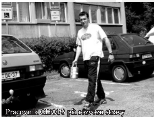
Pracovník CHOPS při rozvozu stravy

Některé ze situací, které dnes a denně zažívají pracovníci Charitní ošetrovatelské a pečovatelské služby, jsou velmi smutné, některé naopak až humorné nebo dokonce neuvěřitelné. Ošetrovatelky a pečovatelky mohou v některých případech velkým dílem přispět ke zlepšení situace klienta, v některých případech to ovšem z různých „objektivních“ příčin nejde, ač by ony samy velmi chtěly.