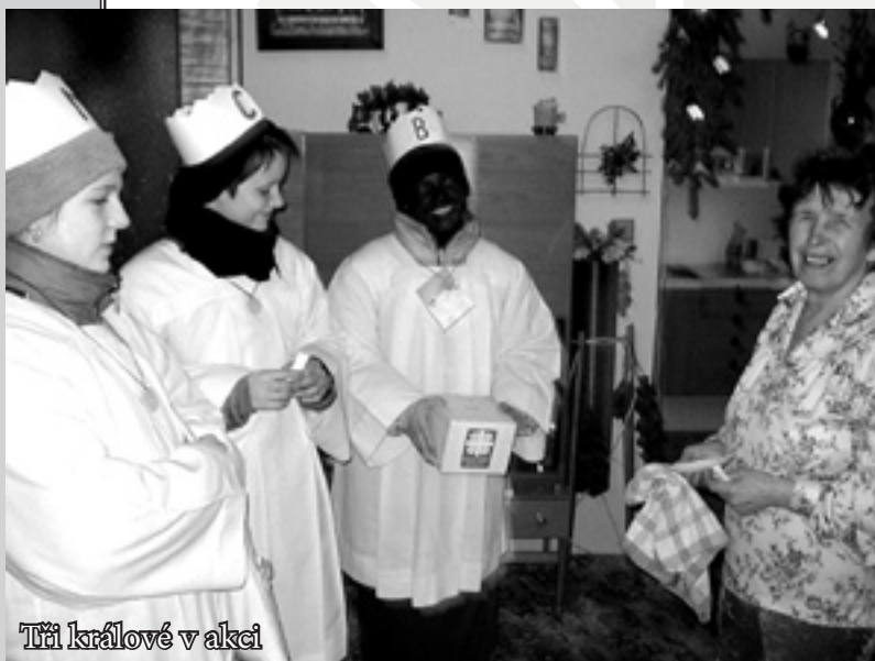
Tří králové v akci

V týdnu kolem svátku Tří králů, který připadá na 6. ledna, se jako každoročně vydaly skupinky koledníků do ulic českých měst a obcí, aby žádali o dary pro Charitu. Ani tentokrát nezůstala Charita Zlín stranou a uspořádala Tříkrálovou sbírku v obcích zlínského regionu. Tříkrálová sbírka je asi největší sbírkovou akcí neziskových organizací v celé České republice a má velký ohlas mezi veřejností i v médiích. Její výtěžek dosáhl v roce 2003 přesně 40 232 287,90 Kč.