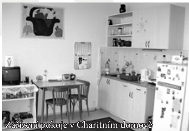
Zařízení pokoje v Charitním domově