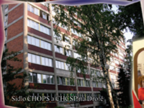
Sídlo CHOPS a CHCSP na Drožďe