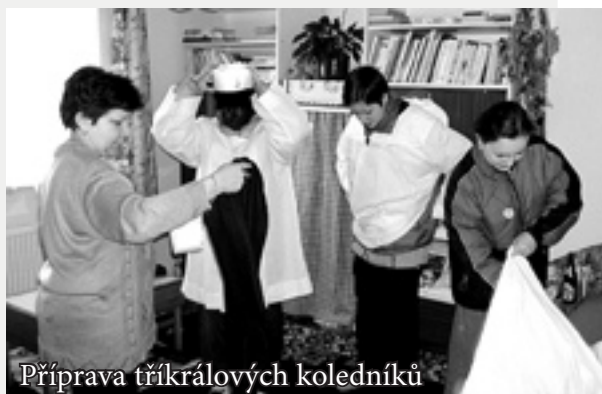
Příprava tříkrálových koledníků

Březnice, Lukov, Malenovice, Mysločovice, Slušovice, Štípa, Velký Ořechov, Vizovice, Všemina, Zlín, Želechovice