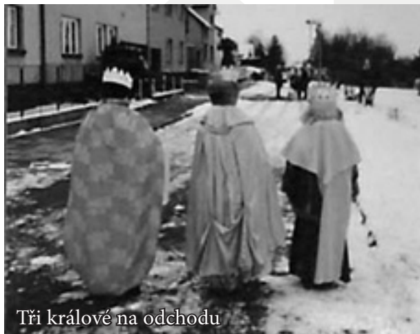
Tři králové na odchodu