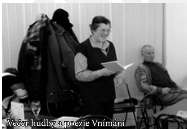
Večer hudby a poezie Vnímání