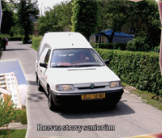
Rozvoz stavby seniorům