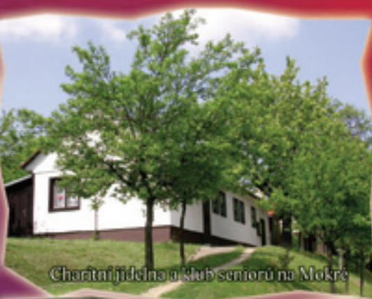
Charitní jídelna a klub seniorů na Mokré