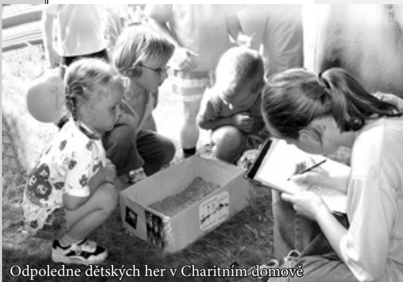
Odpoledne dětských her v Charitním domově

S lužba směřuje k řešení a prevenci sociálně-patologických jevů, se kterými se uživatelé služeb potýkají. Jde zejména o fyzické a psychické domácí násilí,