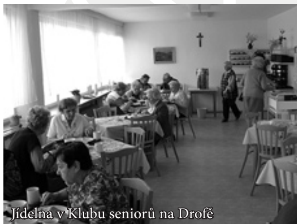
Jídelna v Klubu seniorů na Droffě