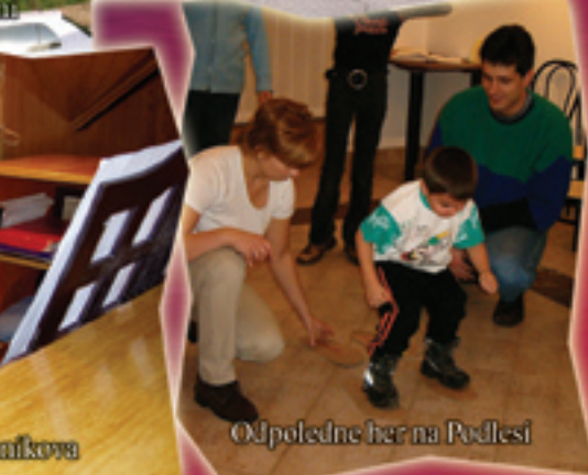
Odpoledne her na Podlesí