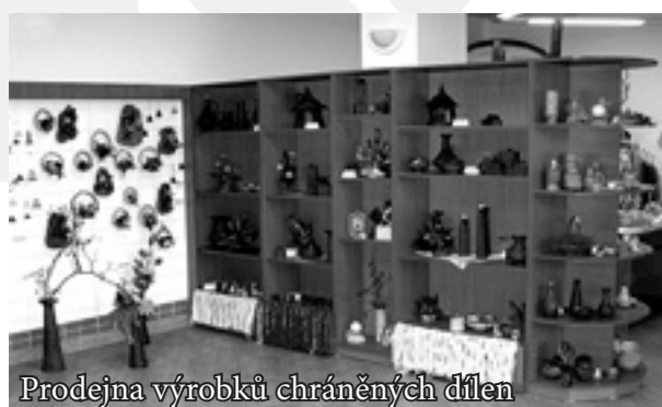
Prodejna výrobků chráněných dílen

T řebaže jsme byli s její prací velmi spokojeni, přece jen jsme cítili jako svou hlavní povinnost vytvořit podmínky pro to, aby si jednou našla jiné zaměstnání. Přihlásili jsme ji na kurz práce s počítačem a hledali vhodné pracovní nabídky, dlouho se nám však příliš nedařilo.