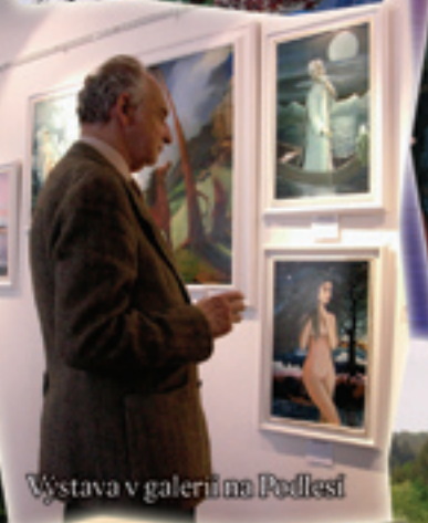
Výstava v galerii na Podlesí