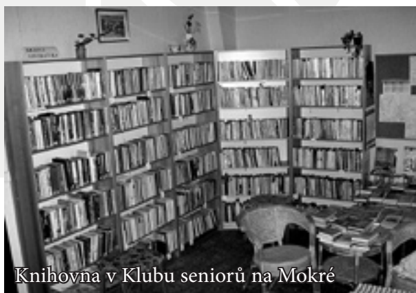
Knihovna v Klubu seniorů na Mokré

S manželi jsme si tehdy povídali dlouho do večera. Postupem času bylo i na pana Františkovi vidět, že by rád zkusil přijít, ale stále převažovaly jeho obavy. Věděli jsme, že mu musíme hlavně nabídnout vhodný způsob dopravy, který jej nebude nutit příliš chodit a nebude jej unavovat. Takový způsob jsme vymysleli; bylo však nutné využít invalidní vozík, o kterém jsme však