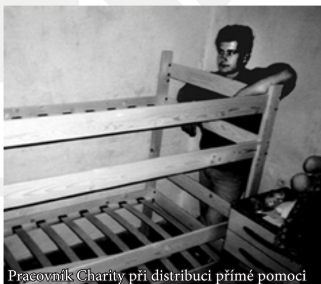
Pracovník Charity při distribuci přímé pomoci