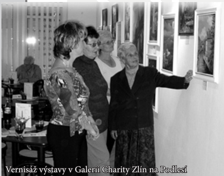
Vernisáž výstavy v Galerii Charity Zlín na Podlesí

Chráněné pracoviště Charity Zlín (CHP) bylo otevřeno v červnu roku 2001. Motivací pro jeho zřízení byla snaha nabídnout pracovní uplatnění a možnost kontaktu se společenským prostředím osobám se změněnou pracovní schopností, které jsou delší dobu v evidenci Úřadu práce. V chráněném pracovišti je uživatelům našich služeb nabízeno zaměstnání uzpůsobené jejich pracovním schopnostem. Do konce roku 2003 zde našlo zaměstnání celkem šest osob.