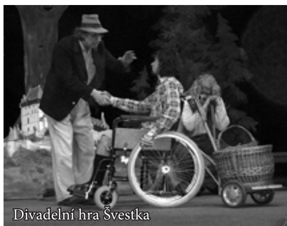
Divadelní hra Švestka

29. listopadu 2003 se uskutečnilo v sále Malé scény divadelní představení hry autorkého tria Cimrman - Smoljak - Svěrák Švestka v podání ochotnického divadla DNO z Vizovic. Jako již tradičně se setkala představení Divadla Nahodilých Ochotníků s obrovským ohlasem a bylo tak symbolickým završením tohoto na kulturní zážitky bohatého roku.