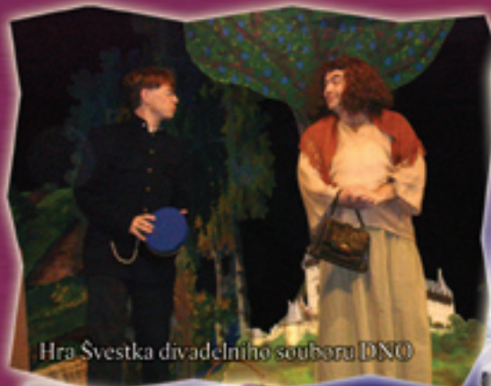
Hra Svestka divadelního souboru DNO