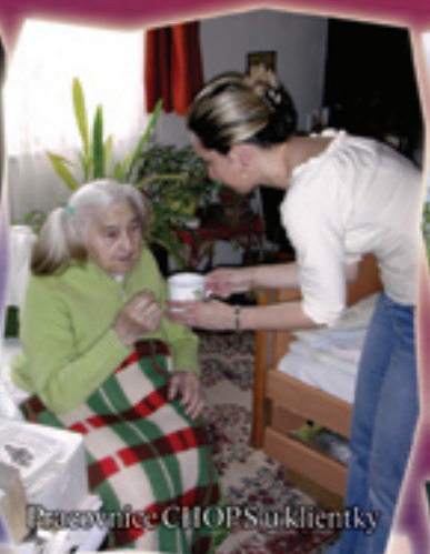
Pracovnice CHOPS u klientky