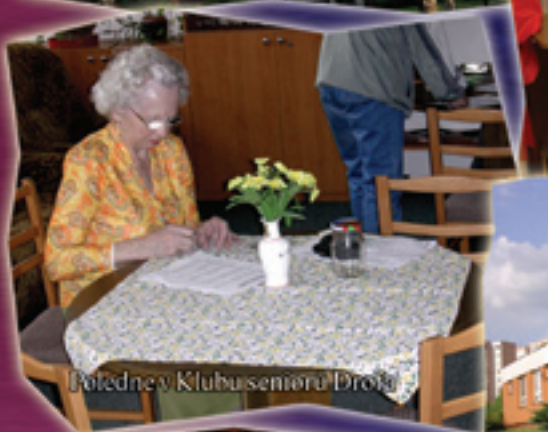
Poledne v Klubu seniorů Drožďe