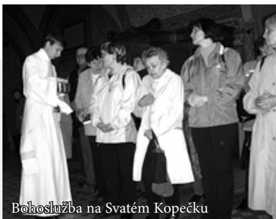
Bohoslužba na Svatém Kopečku

18. září 2003 jsme připravili pro členy Charitního klubu seniorů tohoto roku již druhý poutní zájezd, tentokrát na Svatý Kopeček u Olomouce. Také tato akce se setkala s velkým zájmem členů klubu i veřejnosti. Po bohoslužbě a prohlídce okolí následovala ještě zastávka v Olomouci spojená s návštěvou zdejších památek.