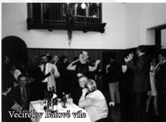
Večirek v Batově vile

14. listopadu 2003 jsme uspořádali společenský večer v reprezentativních prostorách Vily Tomáše Bati spojený s plesem Charity Zlín a tombolou. Večirek byl koncipován jako poděkování sponzorům a pracovníkům institucí, které v právě končícím roce s Charitou Zlín spolupracovaly.