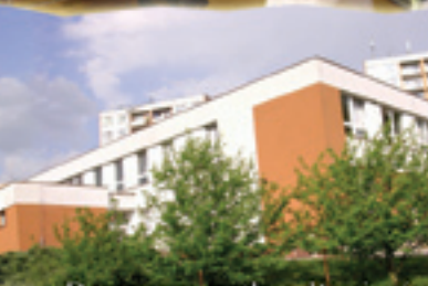
Domov pro matky s dětmi v tesně