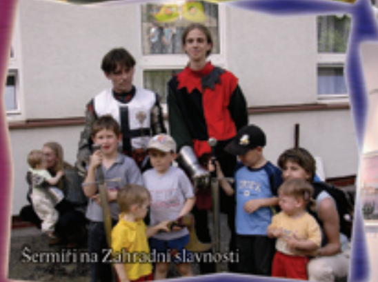
Sermíři na Zahradní slavnosti