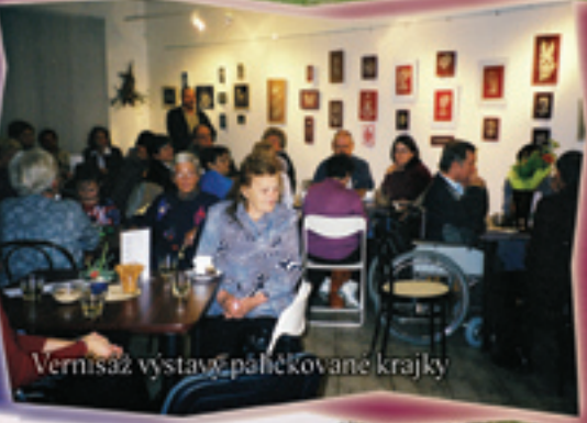
Vernisáž výstavy páhčkové krajky