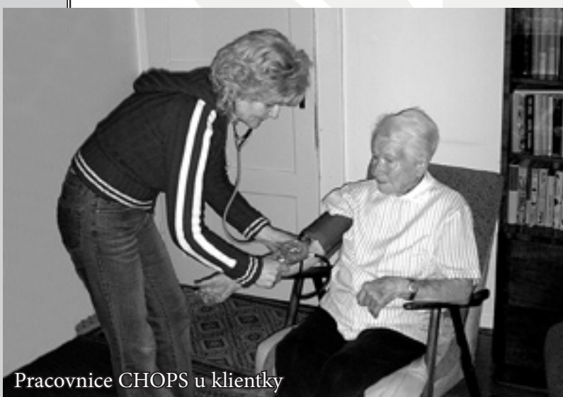
Pracovnice CHOPS u klientky

Charitní ošetřovatelská a pečovatelská služba Zlín (CHOPS) je nejstarší součástí Charity Zlín. Poskytuje své služby od roku 1991. Jde o agenturu domácí péče, jejímž posláním je nabídnout pomoc lidem v nepříznivé zdravotní a sociální situaci, která vznikla v důsledku jejich věku, nemoci nebo ztráty soběstačnosti. Díky této péči mají uživatelé možnost žít i nadále doma ve svém přirozeném prostředí a zachovat si tak křehkou síť emocionálních a sociálních vazeb na své okolí.