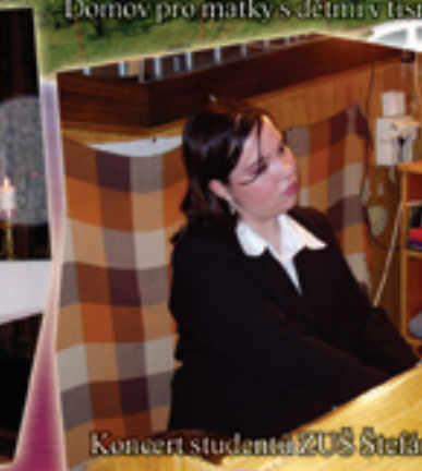
Koncert studentů ZUŠ Štefánikova