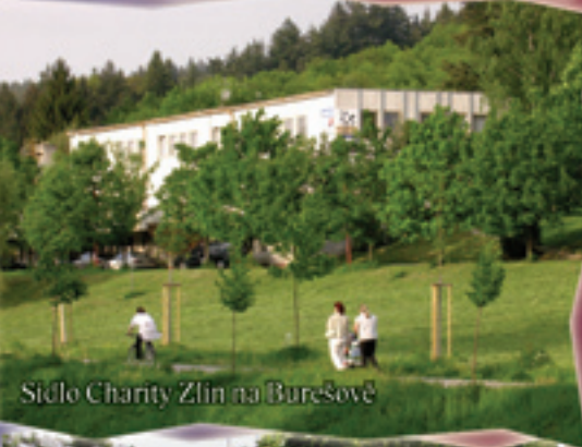
Sídlo Charity Zlín na Burešově